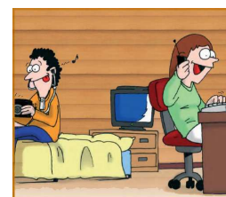
Imágenes de las páginas referenciadas

Es importante no consumir televisión, ordenador ni videoconsolas por la mañana y no permitir que dejen de hacer lo que tienen que hacer por usar los medios ni que estos les impidan desarrollar sus actividades cotidianas.