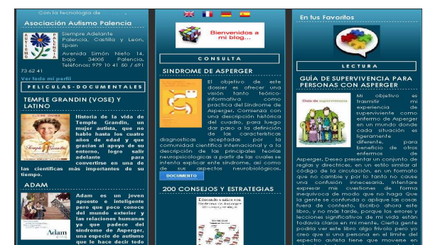
Imágenes de las páginas referenciadas

Además es de fácil lectura y de carácter eminentemente práctico lo cual ayuda a encontrar estrategias para solucionar problemas cotidianos de una manera rápida y eficaz.